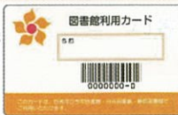
図書館利用カード

図書館利用カードを作ると、本などの資料を借りることができます。また、パスワードを登録すると、自分で本などの予約や貸出状況の確認などができるようになるので、更に便利になります！（無料です）